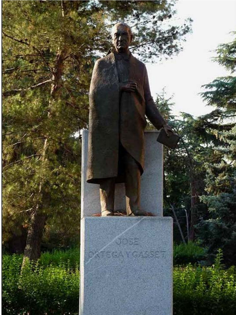
Escultura de José Ortega y Gasset en los jardines de la Facultad de Filosofía de la UCM