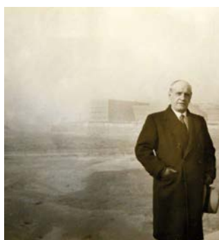
José Ortega y Gasset ante la Facultad de Filosofía y Letras (1934)

Situación: Edificio A, ala dcha., planta 3