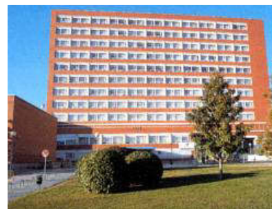
Facultad de Filosofía – Edificio B

de los edificios de la Facultad. Asimismo, algunas clases se imparten en el edificio Federico de Castro, conocido también como «Multiusos» o «Edificio E», situado en la plaza intermedia entre el edificio A y B.