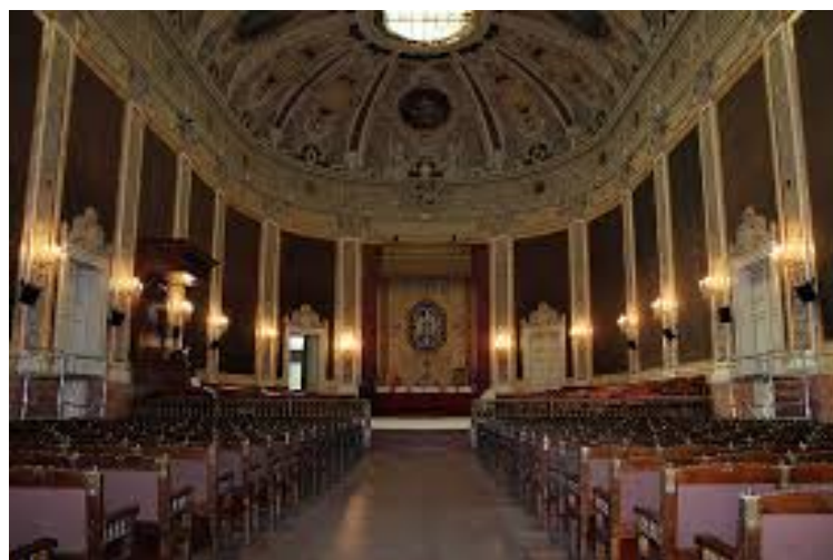
Paraninfo de la Universidad Complutense de Madrid

En 1973 se segregaron sus estudios en tres facultades, una de ellas la de Filosofía y Ciencias de la Educación, dándose en ella su división y creación de la actual la Facultad de Filosofía en 1993.