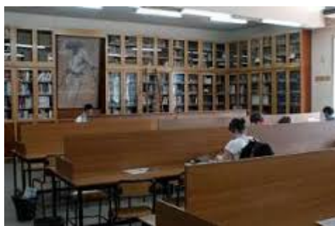
Biblioteca de Filosofía Sala de Lectura

Todo estudiante puede solicitar en la Biblioteca de Filosofía la adquisición del material bibliográfico que precise para sus estudios o investigación. Existe también un servicio de préstamo interbibliotecario.