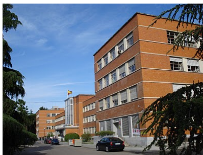
Facultad de Filosofía – Edificio A

La numeración de las aulas comienza por la letra del edificio en el que están situadas (A o B) seguidas de un número. La identificación de los seminarios , en ambos edificios, empieza directamente por la letra "S". La primera cifra de la numeración corresponde a la planta o nivel donde se ubican las aulas y los seminarios dentro